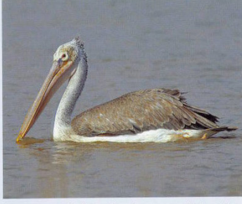
உலக அளவில் அழியும் தருவாயில் உள்ள சாம்பல் நிற கழைக்கடா