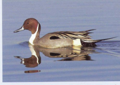
ரஷ்யாவிலிருந்து அதிக அளவில் வருகைதரும் ஊசிவால் வாத்து