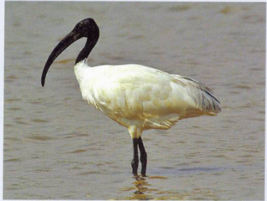
இமயமலை பகுதியிலிருந்து அதிகமாக வருகைதரும் வெள்ளை அரிவாள்க்கை