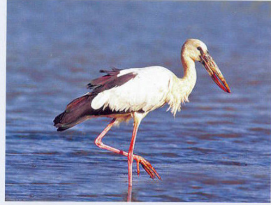
வடஇந்தியாவிலிருந்து வழக்கமாக வருகைதரும் நத்தை கொத்திநாரை

இச்சரணாலயத்தில் நவம்பர் மற்றும் டிசம்பர் மாதங்களில் வாத்து மற்றும் சிறவியினப் பறவைகள் மிகுதியாக இருப்பதால் பறவைகளின் எண்ணிக்கை உச்சத்தில் இருக்கும். இச்சரணாலயத்திற்குள் உள்ள மண்குன்றுகள் இடம்பெயர்ந்து வரும் நீர் பறவைகளுக்கு இளைப்பாறுமிடமாக விளங்குகின்றன. மேற்படி மண்குன்றுகள் மீது கருவேள், நீர்கடம்பு மற்றும் கொடுக்காபுளி முதலிய மரங்கள் நீர்பறவைகள் இளைப்பாறுவதற்கு நடப்பட்டுள்ளன. கொக்கு, வக்கா, மடையான் மற்றும் பலவகை மீன்கொத்தி போன்ற பறவையினங்கள் இச்சரணாலயத்திலேயே வசிப்பவற்றுள் அடங்கும். இச்சரணாலயத்தில் வக்கா மற்றும் மடையான் போன்ற நீர்பறவைகள், கூடுகட்டி குஞ்சு பொரிக்கும் நிகழ்வு வழக்கமாக நடைபெற்று வருகிறது.