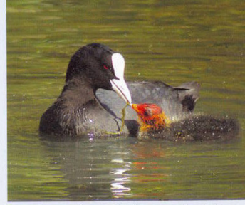
நவம்பர் - டிசம்பர் மாதங்களில் அதிக அளவில் வரும் நாமக்கோழி