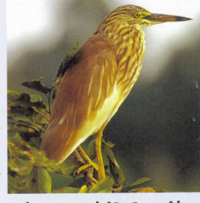
இச்சரணாலயத்திலேயே வசித்து வரும் மடையான்