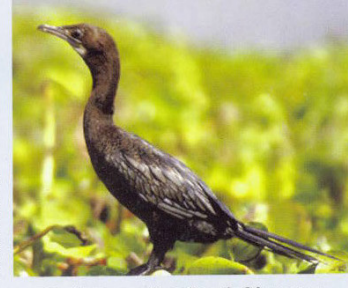
இடம் பெயரும் உள்ளூர் நீர்பறவை நீர்காகம்

இச்சரணாலயம் மேட்டூர் நீர்த் தேக்கத்திலிருந்து ஆகஸ்ட் மாதம் முதல் டிசம்பர் முடிய தண்ணீர் பெறும், அடிப்படையான பாசன ஏரியாகும். ஜனவரி மாதம் நீர் வற்றத் துவங்கி மார்ச் மாத வாக்கில் முழுமையாக வற்றிப் போய்விடுகிறது. இச்சரணாலயம் தஞ்சாவூர் - மன்னார்குடி நெடுஞ்சாலையை ஒட்டி அமைந்துள்ளதால் ஏரளமான பொதுமக்கள் பார்வையிட வருகின்றனர். பறவைகளை கண்டுமகிழ சாலையோரத்தில் ஒரு பார்வை மாடமும், சரணாலயத்தின் உள்ளே ஒரு பார்வை மாடமும் உள்ளன.