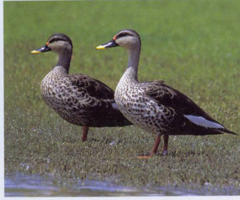
உலகின் பெரிய வாத்துகளில் ஒன்றான புள்ளிமுக்கு வாத்து